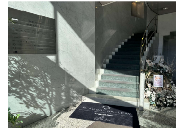
12 階段を上がって、受付までお越しください。(エレベーターのご用意もごさいます)