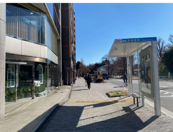
10 京王バスのバス停「新宿御苑」が見えます。