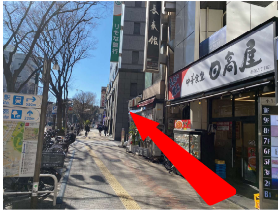
2 地上 (C5) に出て、日高屋を右手に直進します。