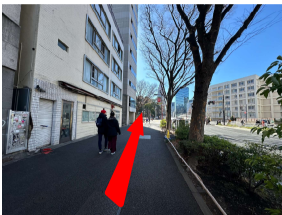
7 「ドトール」を左手に通り越して、直進してください。