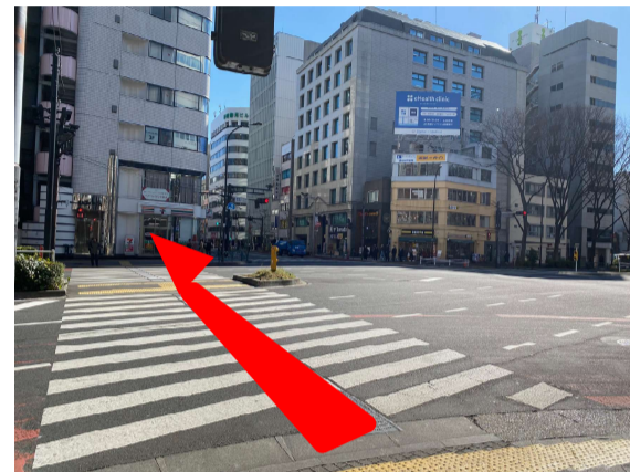
5 角にリソナ銀行がある「新宿二丁目」の交差点を左折し、横断歩道を渡りセブンイレブンに向かいます。