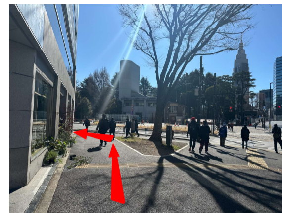
8 交差点の角にあるカフェ「PARKER」を左折してください。