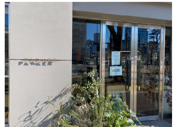
9 交差点の角にあるカフェ「PARKER」の外観はこちら