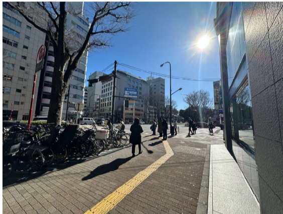
4 リソナ銀行が右手に見え、新宿二丁目の交差点に出ます。