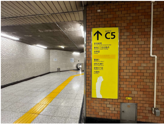
1 改札を出てから、C5出口に向かいます。