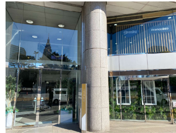
11 バス停の向かい側のこちらのビルになります。